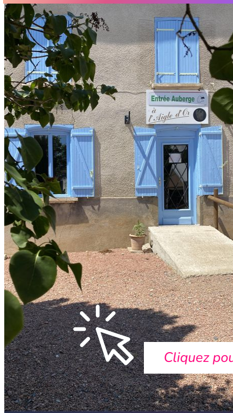
L'aigle D'or à Cherier