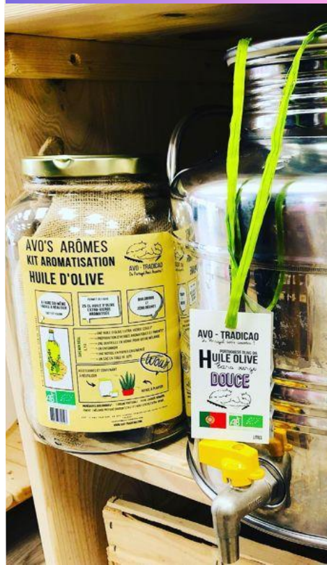
Vrac&Co au Coteau