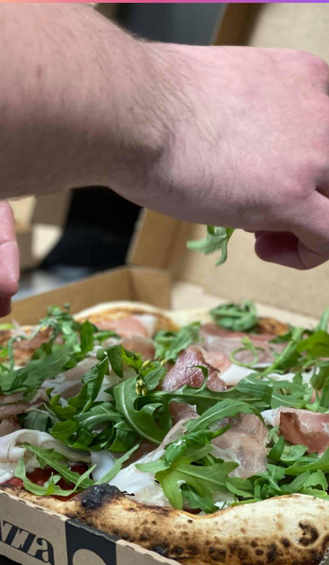
Suprême Pizza à Renaison